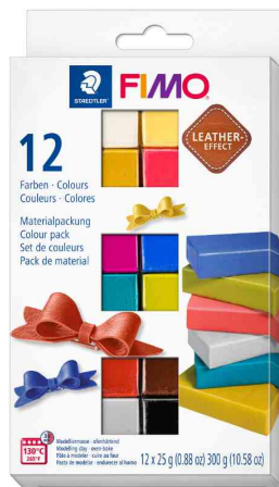
Modelliermasse-Set EFFECT LEATHER, 12er Set