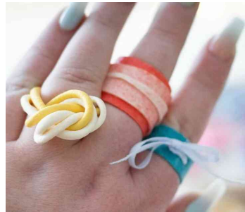
Kreativtipp: Chunky Rings