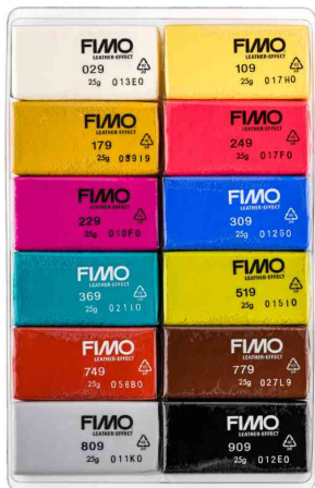
Modelliermasse-Set EFFECT LEATHER, 12er Set