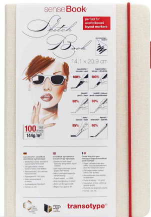
Skizzenbuch "senseBook sketchbook", DIN A5