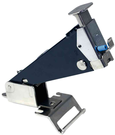
Elektro-Heftgerät Classic 106E