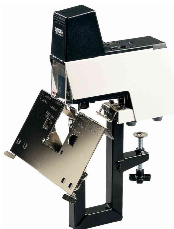
Elektro-Heftgerät Classic 106E mit Arbeitstisch