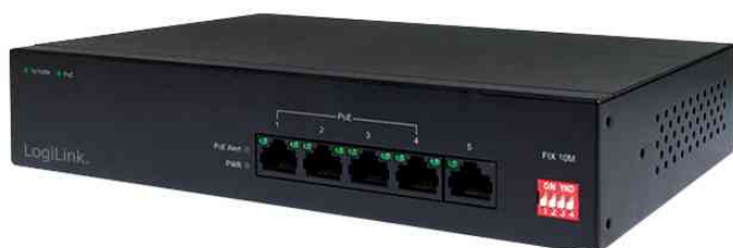
Desktop Fast Ethernet PoE Switch, 5-Port