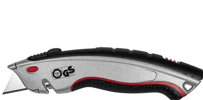
Safety-Cutter Profi Plus