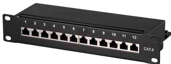
10" Patch Panel Kat. 6, schwarz