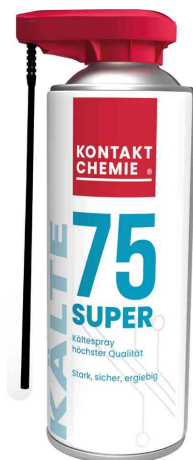
Kältespray "KÄLTE 75 SUPER"